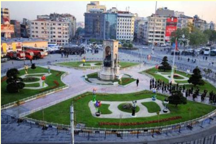
TAKSIM MEYDANI TAKSIM SQUARE